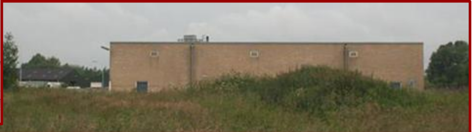
Hier stond van 1884 tot 1927 de Openbare School. Van 1927 tot 1961 was het de R.K. Jongensschool.