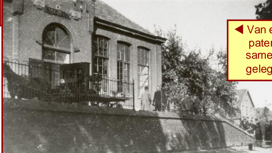
Van 1961 tot 1992 in gebruik als chemische fabriek (Swarfega, later Dreumex). Gesloopt in 1992.