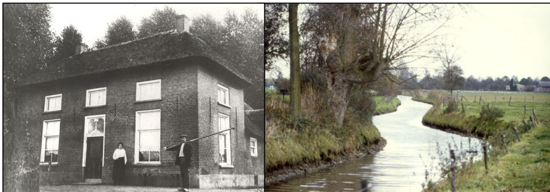
Links: voormalig café 't Schutlaken, pleisterplaats voor boeren en passanten; rechts gedeelte van de oude wetering

We zijn nu bij 't Schutlaken (zie voor uitleg over deze naam: www.tremele.nl/verenigingen/carnavalsvereniging ) en staan op een heel oud en heel bekend punt aan de uiterste rand van Dreumel. Rechts van het pand stroomt nog een gedeelte van de oude wetering, die kronkelt langs het natuurgebied de Meren.