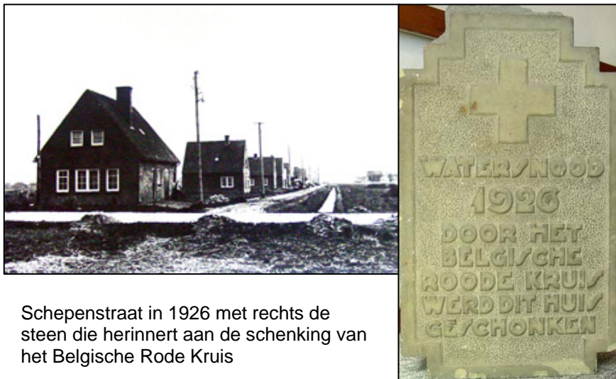
Schepenstraat in 1926 met rechts de steen die herinnert aan de schenking van het Belgische Rode Kruis

Schepenstraat nr. 7 is de woning die geschonken is door het Belgische Rode Kruis. De steen die eertijds in de voorgevel zat, is tegenwoordig in het streekmuseum in Beneden – Leeuwen te bewonderen.