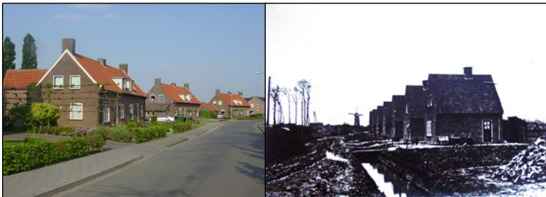
Hofhooistraat: Links: 3 blokken van 2 woningen gebouwd in 1948; rechts watersnoodwoning in 1926, gezien vanuit de Margrietstraat

Links over de drempel staan vanaf nummer 27 watersnoodwoningen (nrs. 27 t/m 39 + nr. 43), gebouwd in 1926, te herkennen aan het spitse dak en het dakdetail. Bijna alle woningen zijn inmiddels verbouwd en aangepast aan de eisen van deze tijd.