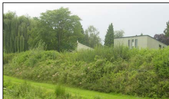
De “kippenhokken”, gezien vanaf de van Heemstraweg

We zien aan de linkerhand een aantal huizen die in Dreumel de “kippenhokken” genoemd worden. (vanaf nr. 18) deze huizen werden gebouwd in de periode 1971-1980.