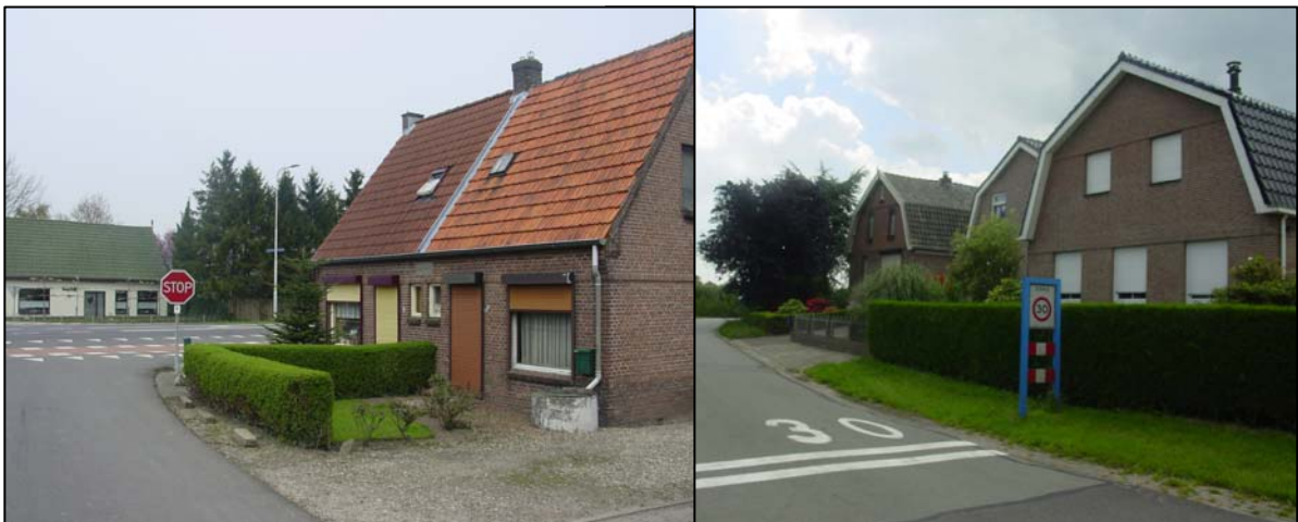
Links: 2 huizen gebouwd door de Schuytstichting na de watersnood van 1926; rechts 3 huizen met gebroken kap, gebouwd na de brand op 7 juli 1931

Aan de rechterkant zien we drie huizen met een gebroken kap. Hun voorgangers gingen in vlammen op in.