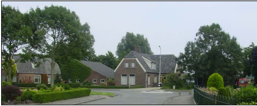
Margrietstraat: midden en rechts achter de bomen een watersnoodboerderij; links een huis met een gebroken kap