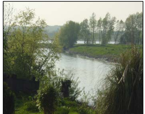
Haven "De Polderbol"