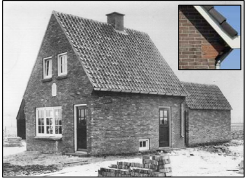
Schepenstraat nr. 7

Aan de rechterkant zien we een hele rij 'watersnood-huisjes'. Ze zijn bijna allemaal flink verbouwd, maar ze lijken wat constructie betreft sterk op elkaar. Een van de kenmerken is bijvoorbeeld de constructie bij de dakgoot (zie foto)