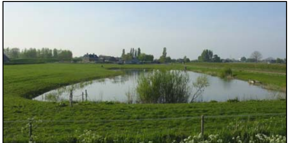
Kleiput t.b.v. dijkverzwaring 1933

De dijk waarop je nu fietst, is nu een verbindingsdijk. Vroeger was deze dijk de vervanger van de "Oude Maasdijk" en beschermde deze dijk ons tegen het Maas en het Waal water. Want heel vroeger vloeiden achter deze dijk de stromingen van de Maas en de Waal in elkaar over. Bij hoog water was Heerewaarden een eiland.