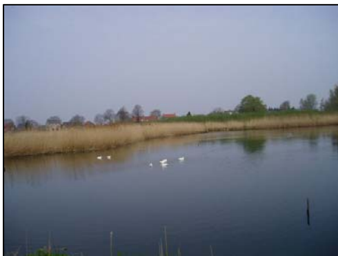
De wielen bij de Griendweg

De Griendweg dankt zijn naam aan de griendbossen die je straks aan je linkerkant ziet. Griendhout werd vroeger maar ook nu nog steeds gebruikt bij dijkverzwaringen en waterkeringen.