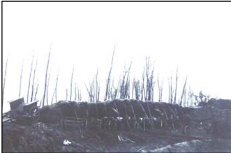
Noodstalling voor vee op de vluchtheuvel