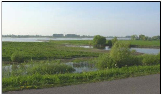
"Het gat van Voet"

Hier vind je ook het kunstwerk van Cor Litjens. Aan de ene kant van de zuil zie je een uiterwaardenlandschap met slechts een vervallen oven en een dijkhuisje. Aan de andere kant zie je allemaal bekende gebouwen.