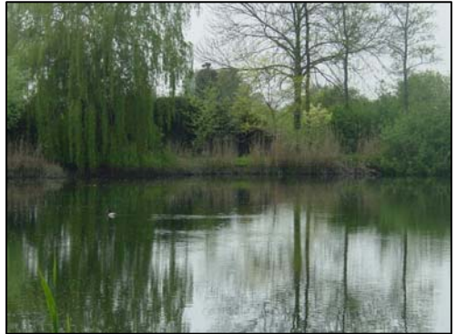
Kleiput Has Strik

Als je goed door de bomen en struiken heen kijkt, zie je een water liggen. Dit is een put. De klei uit deze put werd in 1933 gebruikt om de Waaldijk te verzwaren. (Eenzelfde put kwamen we al tegen bij nr. 9). In dat jaar werd de Waaldijk tussen Dreumel en Druten verzwaard. (Misschien nog wel verder?) In de volksmond staat deze bekend als de "kleiput van Has Strik".