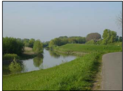
Links: de kleine Kil; rechts: de grote Kil