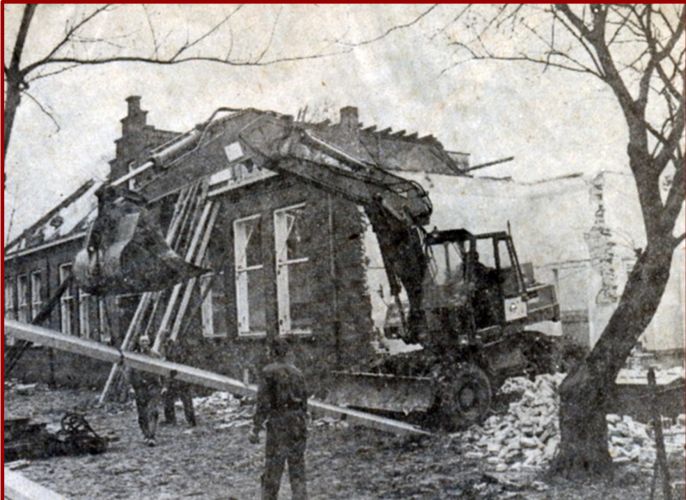
▲ Na de nodige discussies in de gemeenteraad viel in 1977 toch het doek voor de meisjesschool.