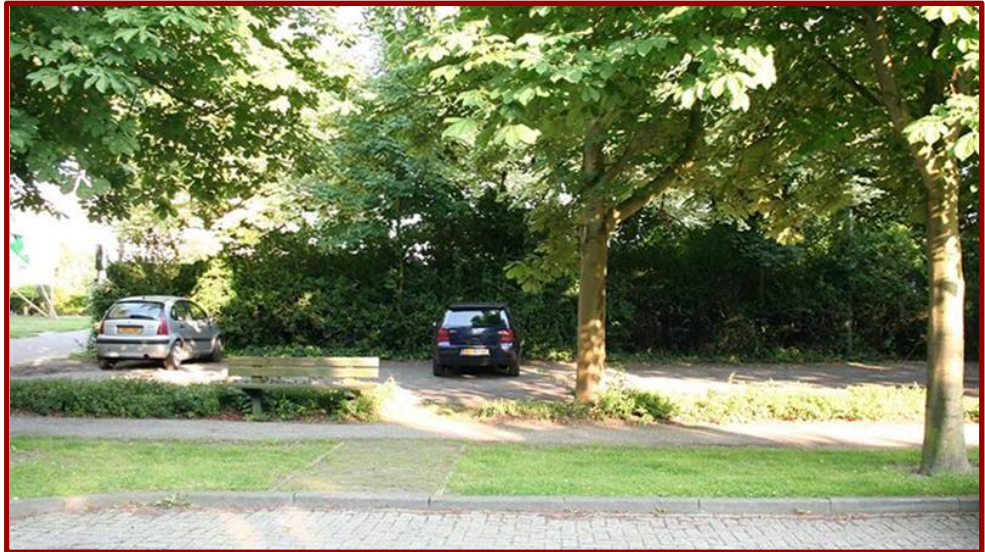
▲ Deze parkeerplaats herinnert in niets meer aan de voormalige meisjesschool.