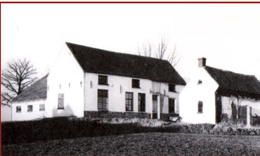
De Sleep kort voor de sloop